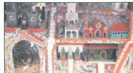
Près de 2000 visiteurs ont parcouru l'exposition depuis le 19 décembre.

Du Jura, de Bienne, de France voisine, de Bâle ou encore de Lausanne: omnipré-