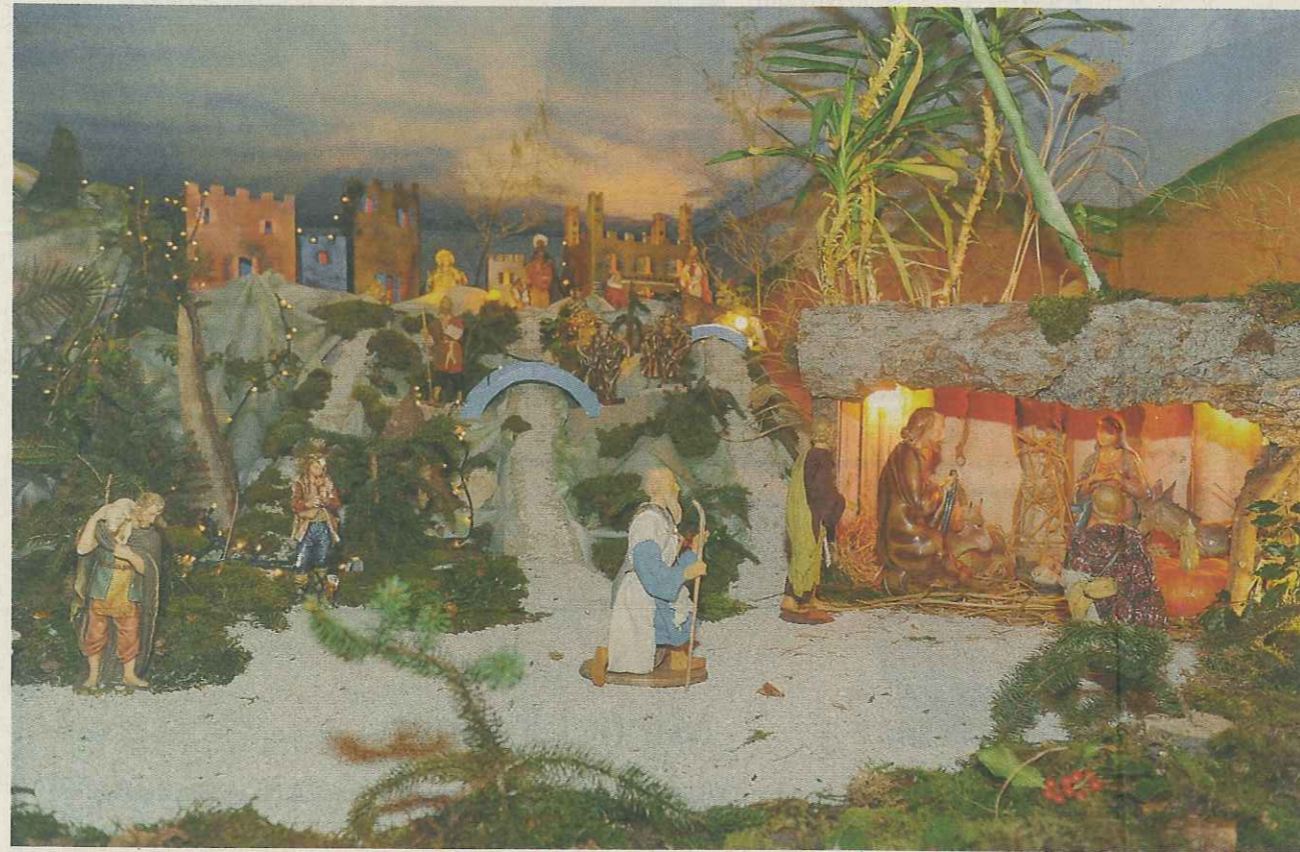
Une quinzaine de personnes ont participé à la création, sur 32 m 2 , de cette scène de la Nativité (ici une vue partielle).