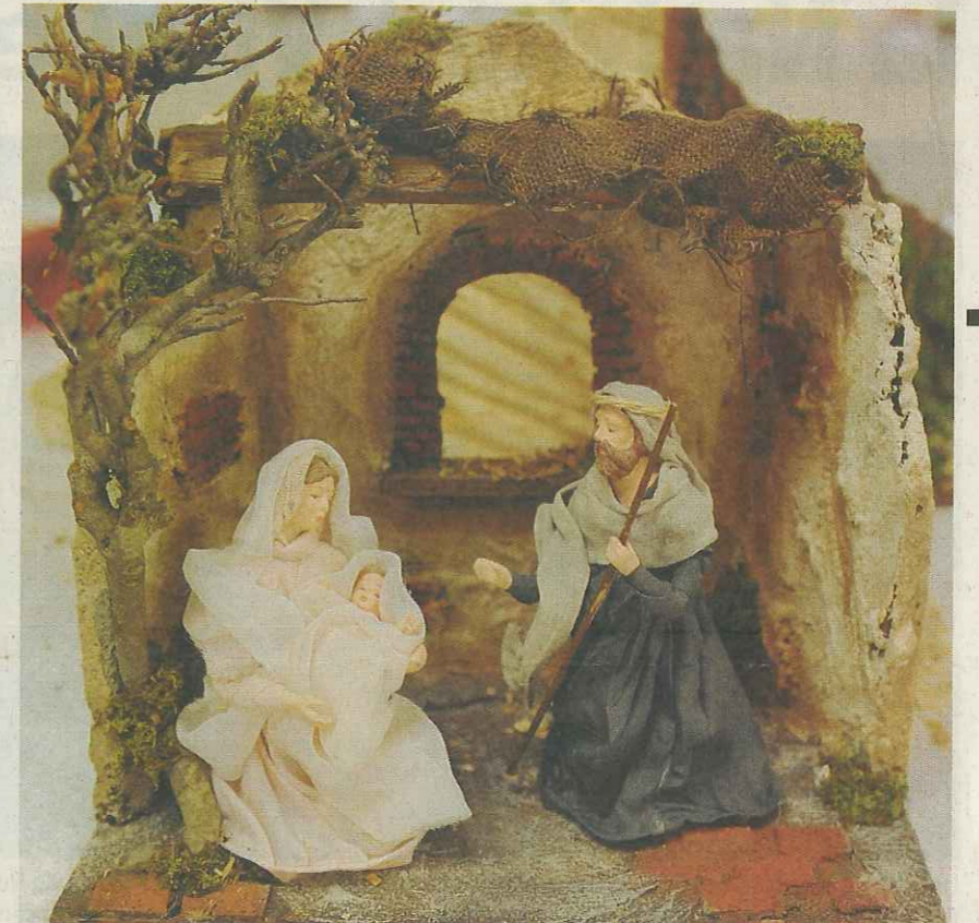
Certains modèles démontrent un souci du détail jusque dans les plis des habits. GERBER